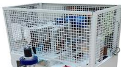
3 – Degelijke omkasting

De RP FL 3 is een inrolmachine voor het aanbrengen van beschermende folie op 3 zijdes van aluminium profielen. Het profiel wordt automatisch ingevoerd middels een dual aandrijfsysteem voor een low-speed invoer van de profielen. Een sensor detecteert in- en uitvoer van het profiel en snijdt automatisch het folie af aan het einde van het profiel, de positionering en doorvoer gebeurt volledig automatisch. De machine kenmerkt zich door de eenvoudige bediening en de hoge kwaliteit.